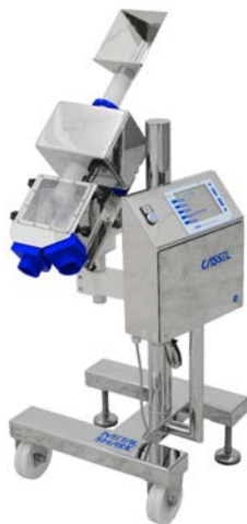
METAL SHARK® Pharma