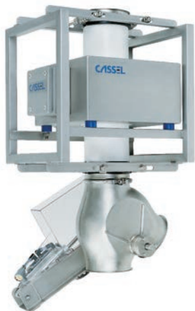
METAL SHARK® Gravitaire