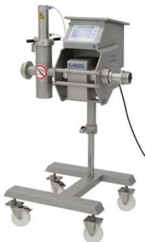
METAL SHARK® IN MEAT