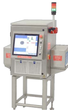
SHARK® Rayons X