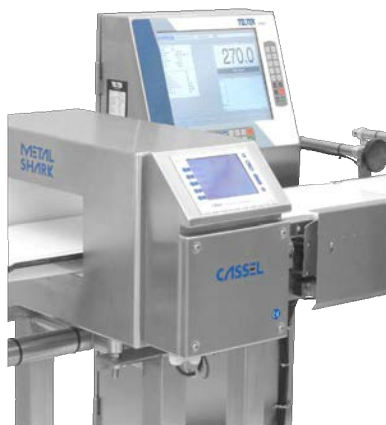
SHARK® trieuse pondérale