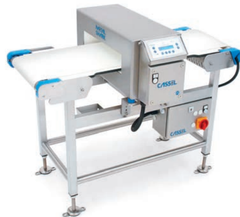
METAL SHARK® HW convoyeur