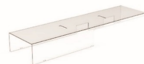
Protection en polycarbonate